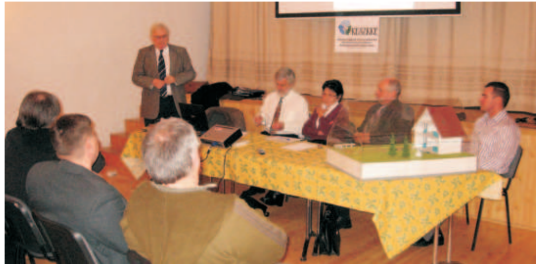
Gyakorlati megoldásokról, üzemeltetési költségekről is szó esett

mokszűrős kislétesítménynél 0 kWh/m 3 ! Mindez forintba konvertálva: 55, 35, illetve nulla fo-