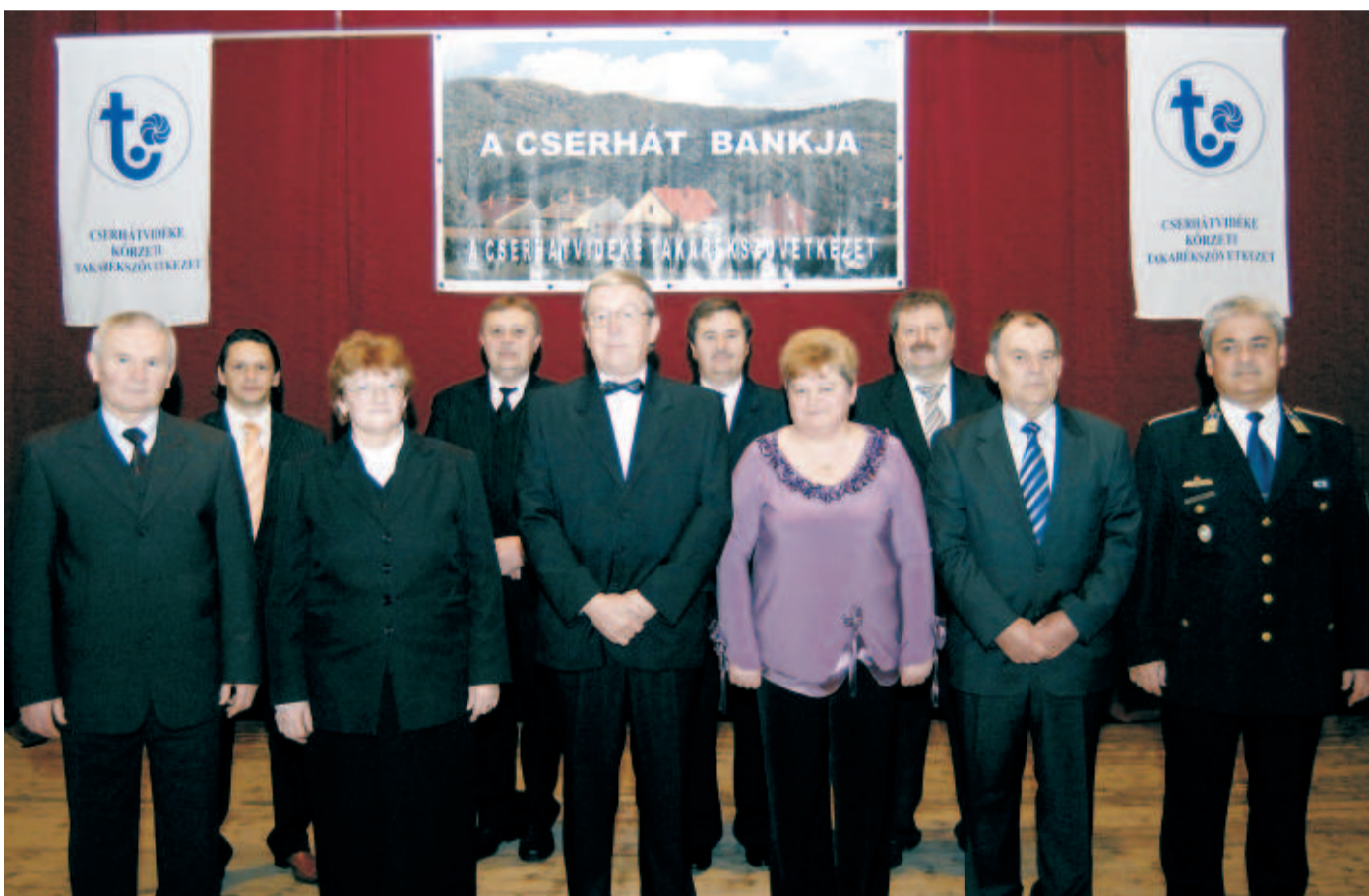
Tizenötödik alkalommal adták át a kítüntető címeket